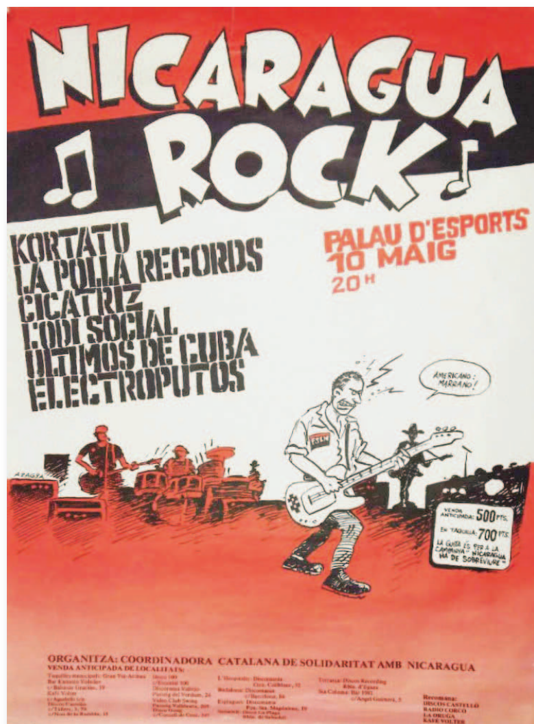
Cartel del mític concert Nicaragua Rock, també de 1986, on van actuar grans grups punks del moment.

Vam tocar amb grups d'Euskadi com La Polla Records, Kortatu o Cicatriz. Com els de Madrid i Galicia tenien un reconeixement institucional, aquí ningú va apostar per la música i quan han despertat ha estat només per donar suport als qui representen una cultura catalana que no critica res.