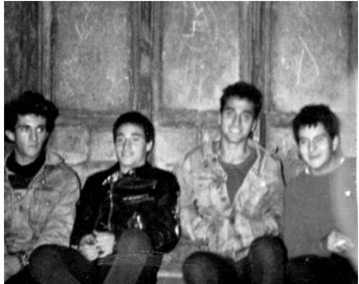
Sobre aquestes línies, fotografia dels components de L'Odi Social de quan van començar (es pot reconèixer al Gos, el segon per l'esquerra). A la dreta, portada del seu disc «Que pagui Pujol».

Espera, més endavant vas dir també «Molts es vesteixen de punks per què