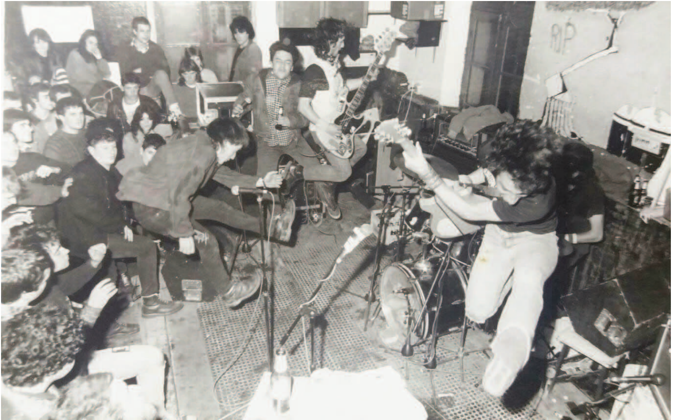
Instantània de L'Odi Social durant un dels seus concerts.